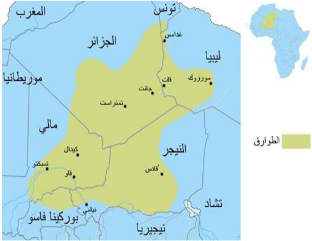
خريطة ( 3 ) توجد الطوارق في أفريقيا