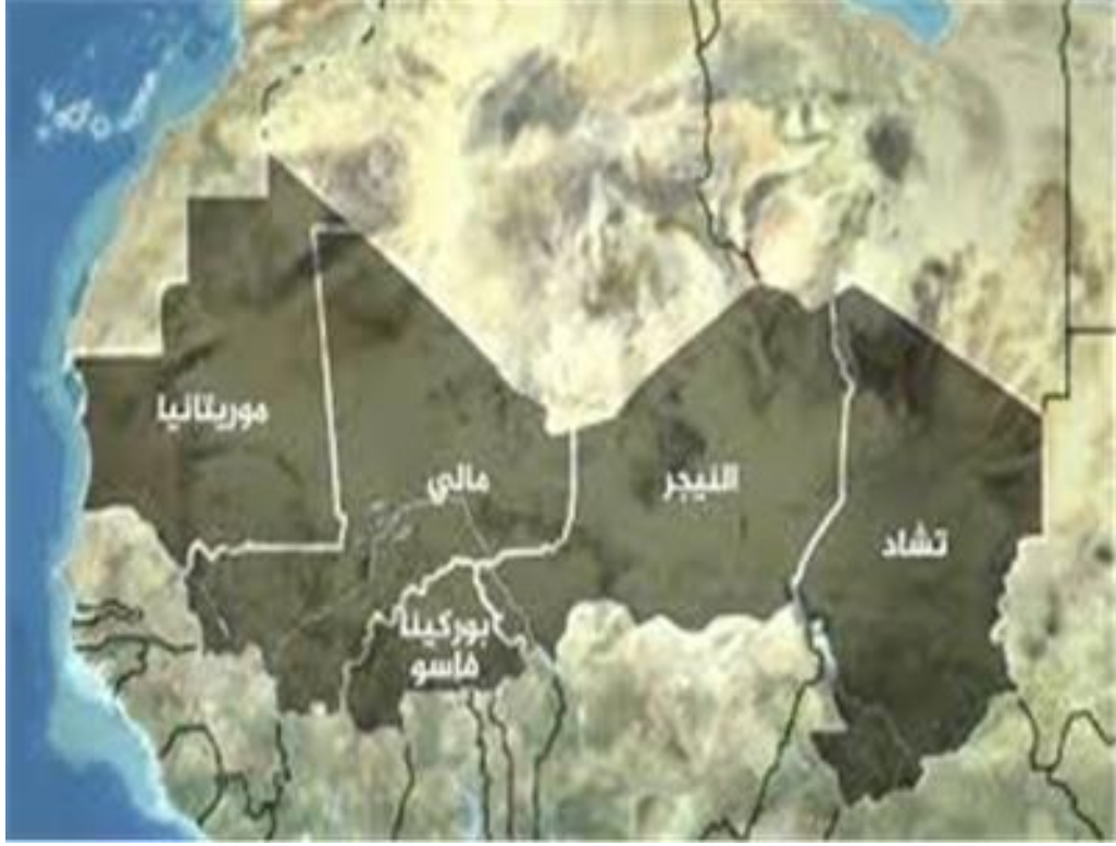
خريطة ( 5 ) دول الساحل الافريقي